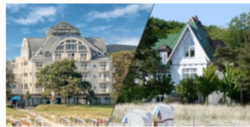
Hotel am Meer und die Villa Nixe auf Rügen

Die Villa Nixe im Ostseebad Binz auf der Insel Rügen wurde nach einer vierwöchigen Renovierungsphase Ostern 2018 wieder eröffnet.